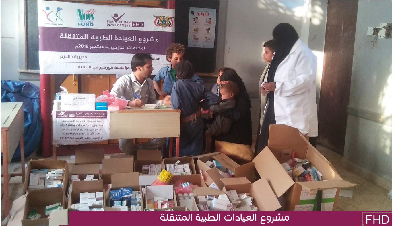
مشروع العيادات الطبية المتنقلة