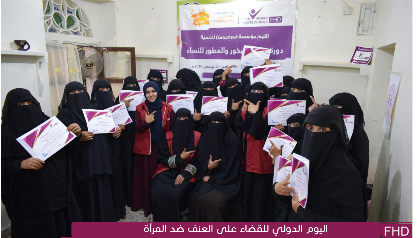
اليوم الدولي للقضاء على العنف ضد المرأة